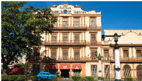
雪茄工廠導賞 (Partagás Cigar Factory)

作為三大產業之一，雪茄彷彿成為了古巴的代名詞。我們在了解雪茄製作過程的同時，探討古巴的經濟與工業。