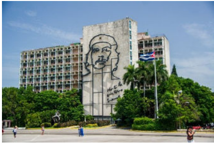
何塞·馬蒂紀念碑 (José Martí Memorial)

高 109 米的五角星形高塔和何塞·馬蒂雕像，紀念這位一代偉人為古巴獨立而付出畢生心力，最後更獻出自己的生命。