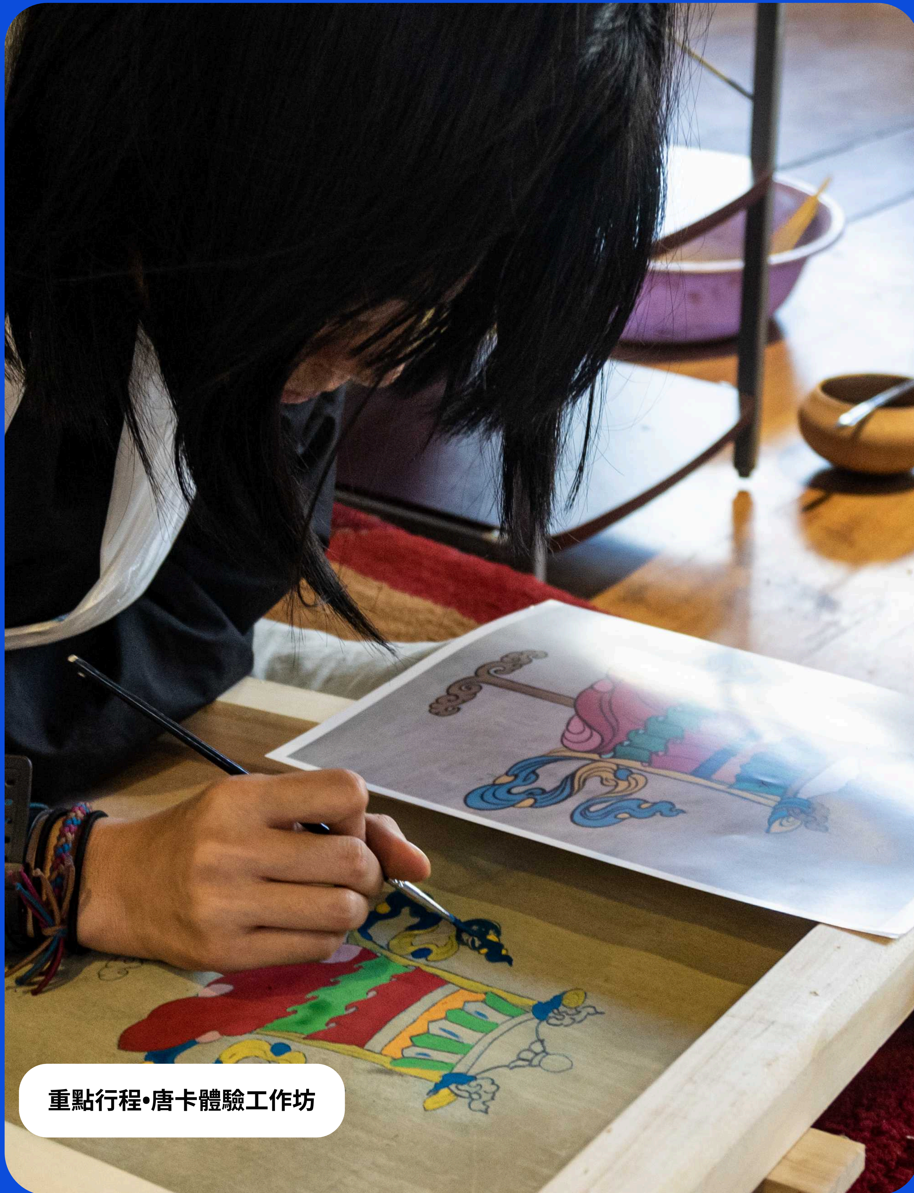
重點行程•唐卡體驗工作坊